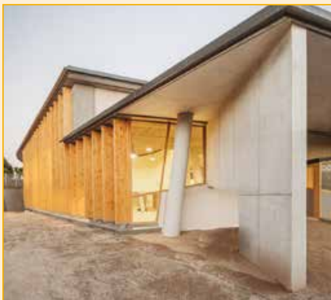
LA NOVA BIBLIOTECA