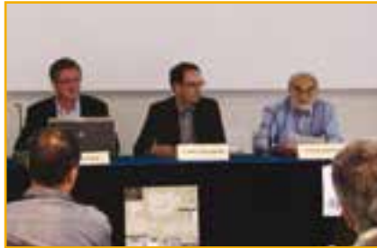
Acte de presentació de l'APAES l'any 2012

Des de la seva creació, l'associació ja ha empès diferents accions. Ha creat un portal propi a Internet on les empreses poden consultar i de-