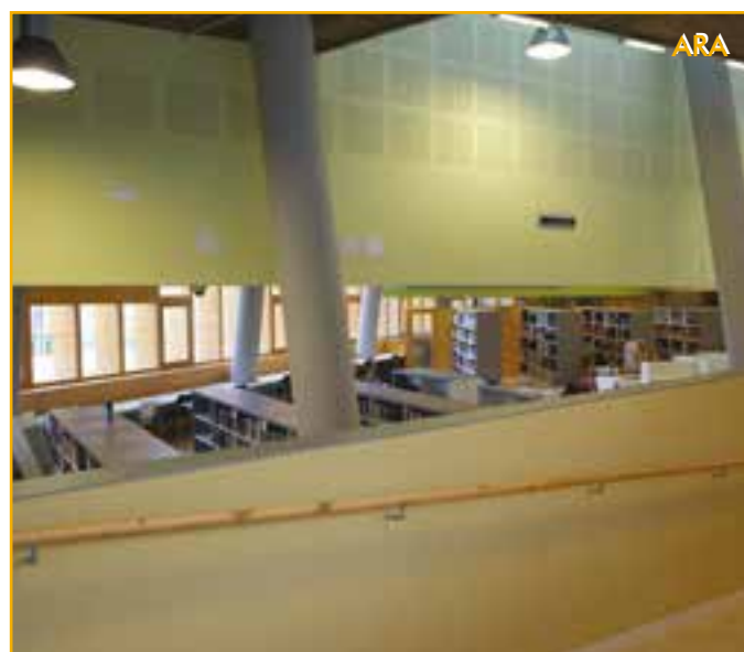
Després d'anys aturat, el projecte de la biblioteca es va recuperar i es va poder obrir el passat 2014

Un treball minuciós ha aconseguit establir les xifres econòmiques del municipi