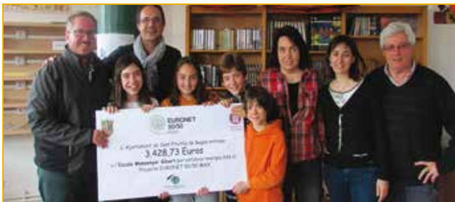
Entrega simbòlica del xec amb els diners dels que disposarà l'escola Monsenyor Gibert gràcies a l'estalvi energètic aconseguit

Entre la resta d'actuacions, destaquen el projecte de substitució de la caldera actual del pavelló d'esports per una de biomassa que en els pro-