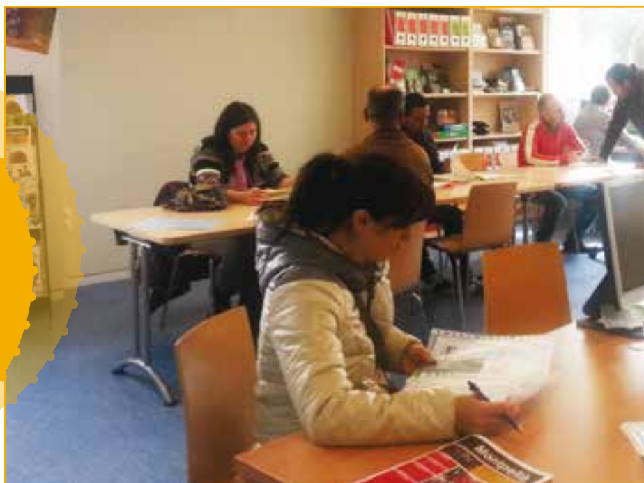
Els veïns i veïnes de Sant Fruitós de Bages disposen de tots els recursos necessaris per buscar feina

El nou servei municipal ha permès la gestió de 250 ofertes de treball