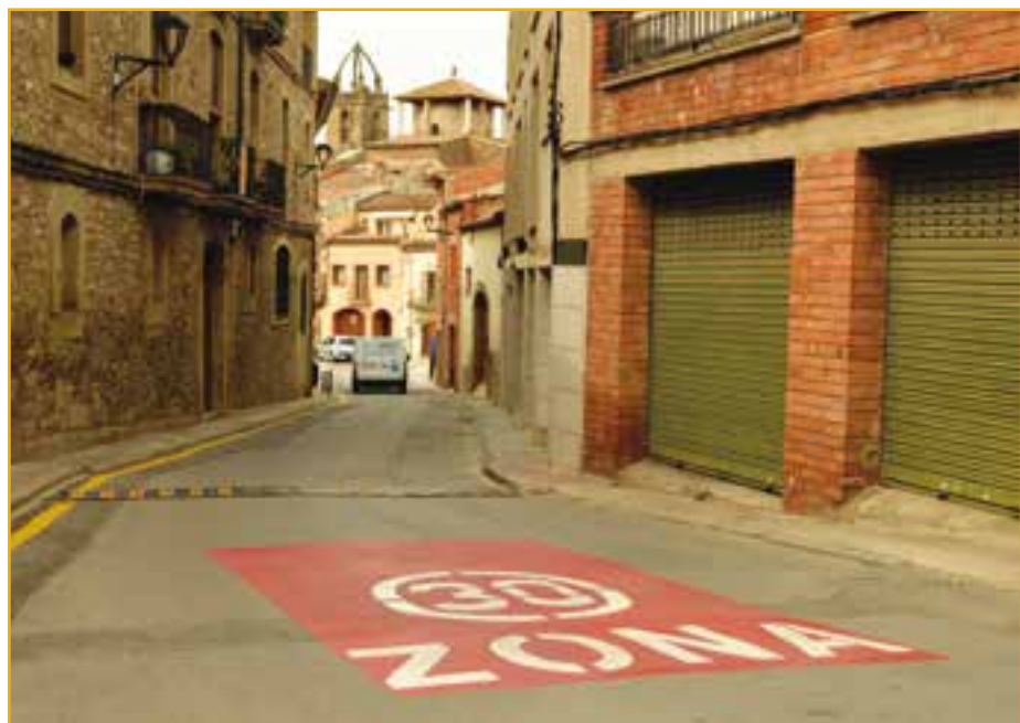
El doble sentit del carrer Sallent i les zones on no es poden superar els 30 quilòmetres per hora, primeres accions visibles del Pla de Mobilitat

La millora de la mobilitat del municipi implica el desenvolupament de diferents actuacions que avui ja beneficien conductors de vehicles, bicicletes i també als vianants