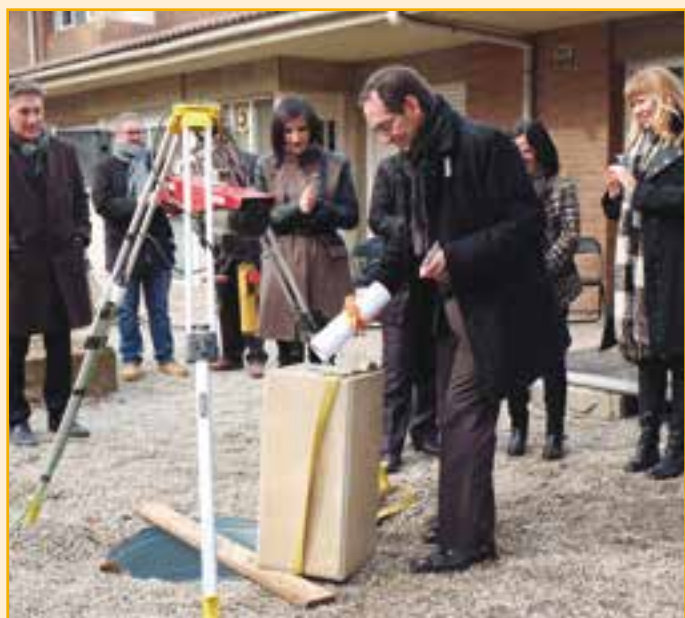
AMPLIACIÓ DE LA RESIDÈNCIA D'AVIS