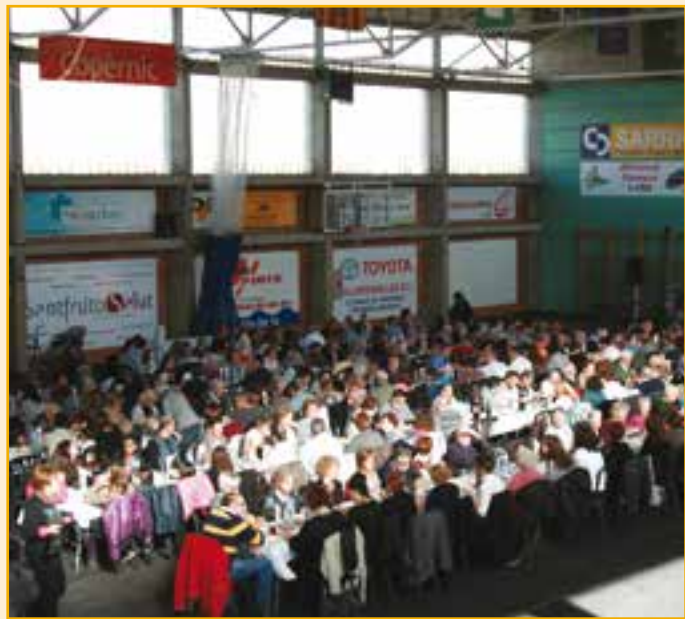
AL COSTAT DELS CIUTADANS