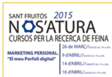
Foto de grup dels participants d'un dels cursos i cartell de la darrera oferta de tallers "Sant Fruitós no s'atura"