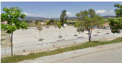
Plaça Primer d'Octubre: en record dels fets succeïts el passat dia 1 d'octubre de 2017.

En el procés participatiu s'han validat els vots d'un total de 372 ciutadans majors de 18 anys i empadronats al municipi. En el cas de la plaça situada a Pineda de Bages, el nom escollit ha estat Plaça Primer d'Octubre per un clar marge de vots, obtenint-ne un total de 205 vots. En segon lloc ha quedat Plaça de la Llibertat amb 127 vots. Altres noms que han obtingut vots han estat Plaça Maurici Serramallera, Plaça de la República, Plaça Marie Curie o Plaça Frida Kalho, entre altres.