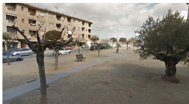
Plaça del Ressorgiment: en motiu de l'estàtua que hi ha ubicada i que s'anomena Escultura del Ressorgiment. Aquesta va ser confeccionada per l'escultora local Neus Serra a petició de l'ajuntament l'any 1989.

Pel que fa a la plaça situada entre Crta de Vic, C/Joan XXIII i C/Albéniz, el resultat ha estat més ajustat. En primer lloc s'ha escollit Plaça del Ressorgiment amb 127 vots, i immediatament després, per un únic vot, ha quedat la Plaça Primer d'Octubre amb un total de 126 vots. Cal recordar que en cas que el nom guanyador en ambdós casos hagués estat el mateix, el nom s'hauria assignat a aquella plaça on obtingués un nombre més elevat de vots.