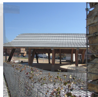
Restauració i urbanització 2017