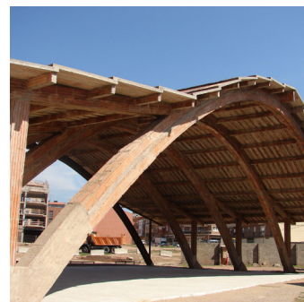
Primera restauració 2005

L'any 1991 el Cobert de la Màquina de Batre va ser adquirit per l'Ajuntament i al 2004 és declarat Bé Cultural d'Interès Local i s'inclou en l'inventari de Patrimoni Arquitectònic de Catalunya. Una de les principals singularitats de l'edifici és el fet que la coberta va ser feta de soletip , una peça ceràmica poc utilitzada a l'estat espanyol. L'any 2005 es restaura tot el conjunt i s'incorpora un arc d'estructura metàl·lica. A partir del 2016 s'inicien les obres de renovació de la coberta de l'edifici i s'engega un projecte d'urbanització de tot l'entorn per convertir-lo en un espai públic de lleure i oci. Aquest espai queda inaugurat el 2 d'abril de l'any 2017, donant un salt qualitatiu a aquesta singular construcció.