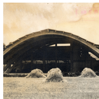
Cobert en funcionament 1955