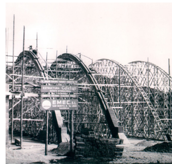
Construcció del Cobert 1950

Fins a mitjans del segle XX el treball al camp era la principal activitat del municipi. Un cop s'acabava la sega es batiën les espigues del cereal per separar el gra de la palla. Aquesta feina es realitzava manualment a l'era dels masos. L'any 1926 la Comunitat de Pagesos de Sant Fruitós de Bages van associar-se per comprar una màquina de batre que van ubicar a l'actual Plaça 11 de setembre. Per tal que la maquinària no es malmetés i les garbes no es fessin malbé per la pluja, es va optar per construir un cobert. A partir dels anys 60, amb l'arribada dels tractors, la màquina va quedar obsoleta i a principis dels anys 70 es va tancar i el cobert va passar a utilitzar-se com a magatzem de maquinària.