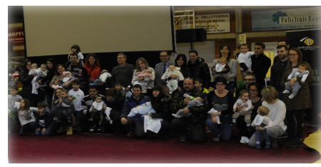
Reconeixement als infants nascuts durant el 2016