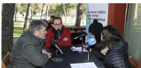
La tertúlia de ràdio Sant Fruitós