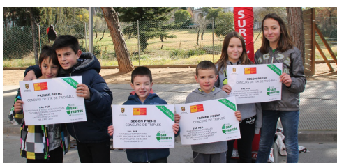
Concurs de Two Ball, triples i footbasket