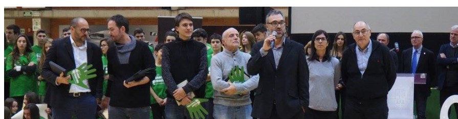
Reconeixement a la comissió organitzadora