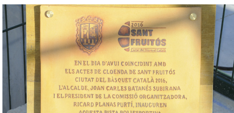
Inauguració de la pista poliesportiva Pla del Puig