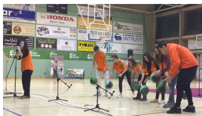
Mostra de Basket Beat