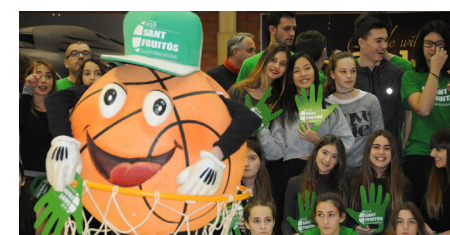
Reconeixement als voluntaris