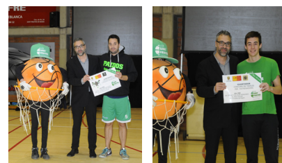
Guanyadors del concurs de triples