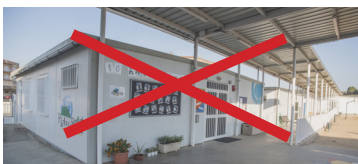
CEIP PLA DEL PUIG