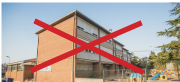
CEIP LA FLAMA