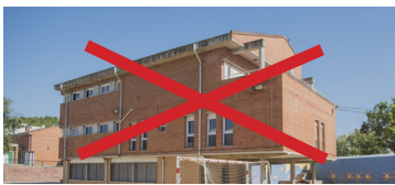
CEIP MONSENYOR GIBERT