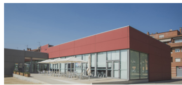
NEXE-ESPAI DE CULTURA