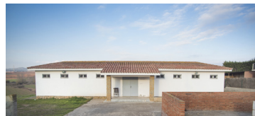
LOCAL AVV PINEDA DE BAGES