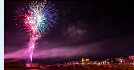
Castell de focs