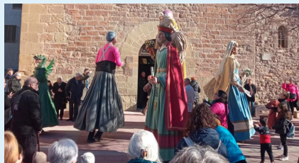
Ball de gegants i sardanes