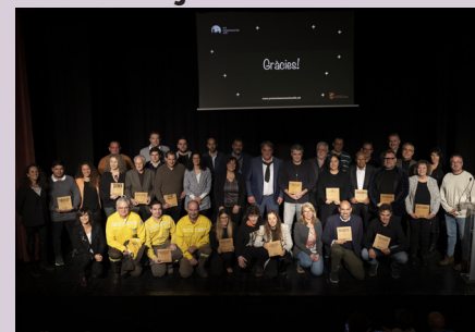
Fotografia grupal dels premiats i homenatjats en l'edició 2022.

ció i desenvolupament, al foment de la cultura i les tradicions, als valors del comerç de proximitat, a la promoció i projecció del territori i a la trajectòria personal. La gala s'ha celebrat aquest desembre al Teatre Casal Cultural.