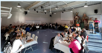
Esmorzar amb les entitats locals