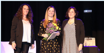
Pregoner: Centre Ocupacional La Sagrera