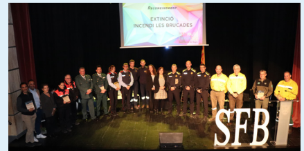
Reconeixement als cossos que van lluitar contra l'incendi a Les Brucardes