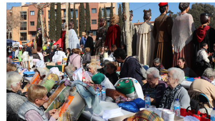
Puntaires a la Festa de l'Arròs 2023.

A banda de la Festa de l'Arròs, feu altres trobades? Durant l'any visitem altres municipis on celebren trobades de puntaires.