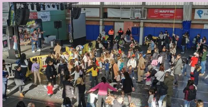
Festa de l'Home dels Nassos