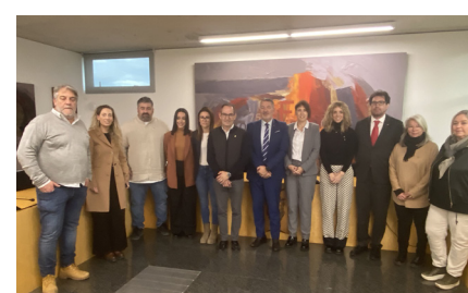
Autoritats presents a la visita institucional