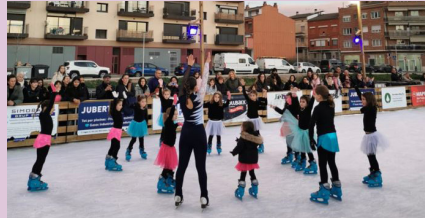
Pista de gel

Durant totes les festes nadalenques els santfruitosencs han pogut gaudir d'un àmpli calendari de propostes nadalenques en el marc de la campanya Viu el Nadal .