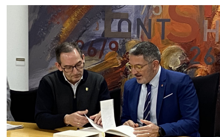
Signatura del llibre d'honor

El conseller d'Empresa i Treball, Miquel Sàmper, ha visitat l'Ajuntament acompanyat pel secretari d'Empresa i Competitivitat, Jaume Baró i ha estat rebut a la sala consistorial per l'alcalde i els regidors, on ha signat el llibre d'honor. Sàmper ha lloat les polítiques en l'àmbit de la promoció econòmica que es duen a terme al municipi, destacant el futur centre empresarial que s'obrirà i també el tracte personalitzat que s'ofereix al teixit empresarial.