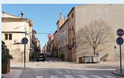
Estat actual del tram objecte de remodelació

tera de Vic. Es tracta de reurbanitzar 1.269 m 2 d'aquest vial que travessa tot el barri antic i que connecta diferents equipaments i amb el que es vol aconseguir un eix viari més segur i agradable per a viants i compradors.