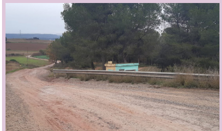
Camí de Sant Iscle a Pineda de Bages

L'Ajuntament està arranjant camins públics del municipi per millorar-ne tant el pas de vianants com el trànsit rodat. Concretament, els camins de Sant Iscle cap a la Fundació Ampans i cap al Riu d'Or i el camí de Viladorris, en el tram cap al Bosc Espès. També s'arranja una part del camí paisatgístic en direcció Sant Benet de Bages. Aquesta actuació està subvencionada per la Diputació de Barcelona on s'ha atorgat al consistori 28.300 euros.