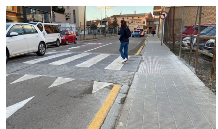
Pas elevat carrer Germán Duran

construint una nova parada per al transport escolar a l'avinguda principal de Les Brucardes, unes obres que també inclouen la construcció de dos nous cordons d'aparcament a la vorera contrària de la parada d'autobús.