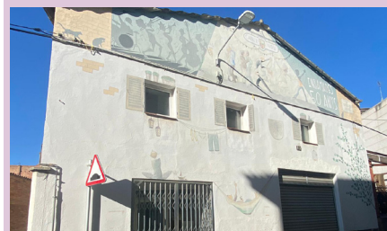
Edifici de la cooperativa La Agrícola

L'Ajuntament ha aprovat la concertació d'un préstec a llarg termini per un import de 4 milions d'euros per a executar la construcció del nou pavelló d'esports i gimnàs de l'escola Pla del Puig, on es destinaran 3.600.000 euros. Aquest crèdit també permetrà executar les obres de reforma de la sala cooperativa l'Agrícola, pressupostades amb 250.180 euros i la reforma de l'edifici de la ràdio municipal, valorada amb 149.820,00 euros. El termini de retorn d'aquest crèdit és a 15 anys.