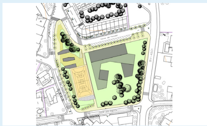
Àmbit de l'Hostal Pineda

L'Ajuntament contractarà la redacció del projecte d'urbanització i del projecte de reparcel·lació de l'àmbit de l'Hostal Pineda. Per una banda es redactarà el projecte per urbanitzar l'àmbit, i per l'altre, s'establiran els costos i condicionants de la reparcel·lació de la zona. El projecte d'urbanització de la zona permetrà definir els espais públics i l'ús futur de la zona de l'equipament, un espai de 10.691 m 2 entre els carrers Parador, Joaquim Blume i dels Esports.