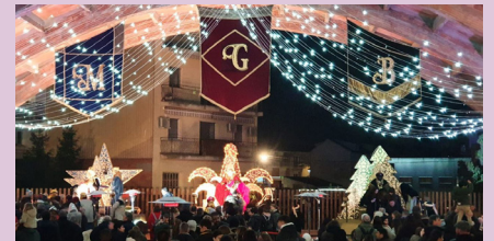
Cavalcada de Reis