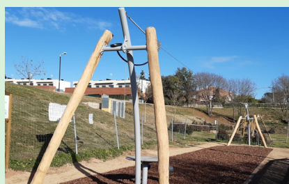
Tirolina al parc de la Font de La Tolega

La zona verda de la Font de la Tolega compta amb una nova tirolina que amplia la zona de joc infantil. Aquest espai fins ara comptava amb un parc infantil i una porteria de futbol. Els treballs que s'hi han realitzat també han inclòs l'enllumenat, la senyalització, la col·locació dels paviments necessaris, el mobiliari urbà i la xarxa de reg i jardineria. La segona fase del projecte preveu la instal·lació d'un nou espai de street workout i aparells de gimnàstica per a la gent gran.