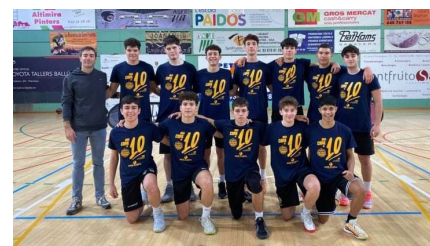
Equip de l'INS Gerbert d'Aurillac

L'institut Gerbert d'Aurillac participa en la Copa Col·legial de bàsquet amb un equip masculí de joves de 1r i 2n de Batxillerat. L'Ajuntament ha signat un conveni de col·laboració amb l'Associació Catalana de Basquetbol Col·legial per promoure la participació dels centres educatius en aquesta competició. Els santfruitosencs van emportar-se el primer partit davant l'institut de Lacetània de Manresa (55-38).