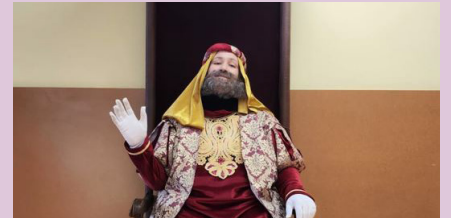
Visita del patge reial a les escoles