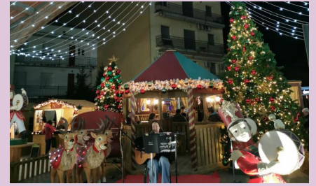
Mercat de Nadal