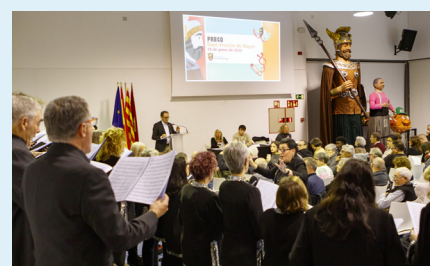
Agrupació Coral Sant Fruitós