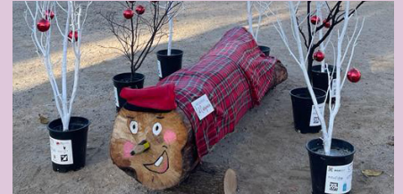
Tions a tot el municipi