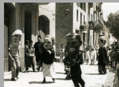
Ball dels capgrossos - Fons Enric Clarena

El quart cap de setmana d'agost tenia lloc la Festa Major d'estiu. Eren dies d'esplai per a la població, un cop acabada la sega i el batre i abans d'iniciar la verema. Balls a l'envelat, concerts, sardanes, representacions teatrals, cinema i també activitats esportives. El canvi de feina de la majoria de la població amb l'arribada de la industrialització va acabar fent avançar la festa a la primera setmana de juliol, tal i com es celebra actualment.