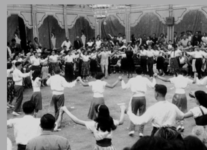
Sardanes a l'envelat - Fons Domènec Espinal