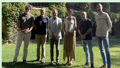
Presentació Óh! Festival

Sant Fruitós de Bages serà present al festival de Sant Benet de Bages mostrant el seu ric patrimoni cultural i gastronòmic. El 12 d'octubre, els visitants podran degustar un plat d'arròs fet per la colla dels cuiners maridat amb una copa de vi dels gegants Sala i Ricardis. Acompanyant a aquesta proposta es comptarà amb una actuació de l'esbart Som Riu d'Or, qui oferiran les seves danses tradicionals als visitants. Aquesta col·laboració entre l'Ajuntament i el Festival és un primer pas per a crear sinergies que ajudin a donar a conèixer arreu, el potencial turístic del municipi.