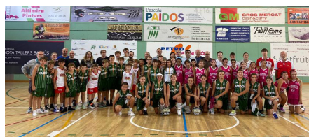
Mini Copa Bages