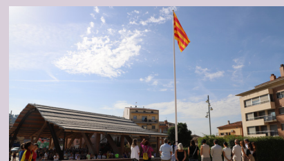
Cant dels Segadors