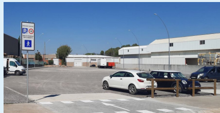
Aparcament carrer Montsant

Jaume Balmes, en una parcel·la de 1.500 m 2 , que es va posar en funcionament just el primer dia d'inici del curs escolar, ja que és un espai amb capacitat per una cinquantesena de vehicles i que