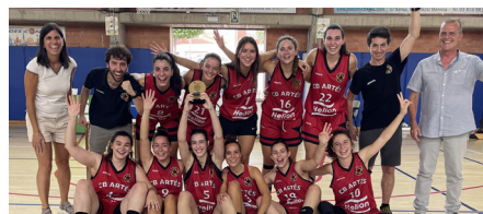
CB Artés - 1r classificat femení - Grup B