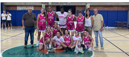
Bàsquet Manresa - 1r classificat femení grup A