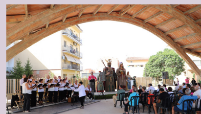
Actuació de la Coral Sant Fruitós