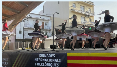
Actuació Ensemble Orgonina

Les 51es Jornades Internacionals Folkloriques de Catalunya, han portat sota el Cobert de la Màquina de Batre el conjunt eslovac Folklore Ensemble Orgonina, qui ens han ofert les seves danses tradicionals. L'esbart Som Riu d'Or, i els Geganters i Grallers del municipi, han estat els ambaixadors locals d'aquestes jornades que van néixer ara fa 51 anys per potenciar i dinamitzar la cultura popular del nostre país i per donar a conèixer a Catalunya el folklore d'altres indrets del món, mitjançant diferents intercanvis culturals.