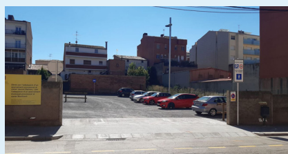
Aparcament carrer Balmes

Aquest mes de setembre s'han obert al públic dos nous aparcaments municipals, que se sumen als 19 amb què ja comptava el municipi. Un dels espais es troba ubicat al carrer