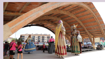
Ball des Geganters i Grallers de SFB