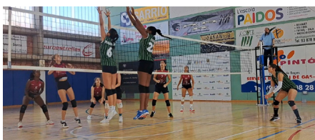
Copa Bages Voleibol