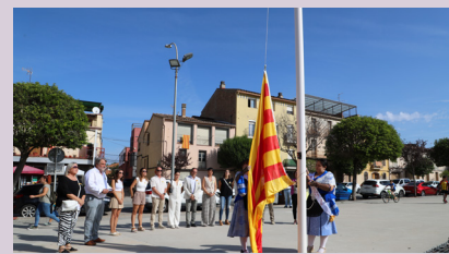
Hissada de la senyera amb la Pubilla i la Dama