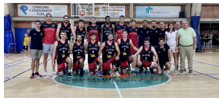
CB Artés - 2n classificat masculí