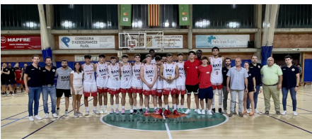
Bàsquet Manresa - 1r classificat masculí