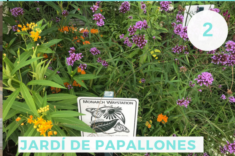
JARDÍ DE PAPALLONES