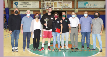
CB Santpedor, equip guanyador en categoria masculina