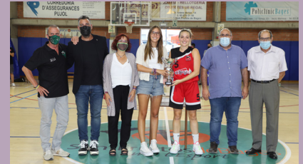
NB Olesa, equip guanyador en categoria femenina