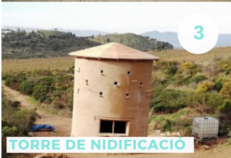
TORRE DE NIDIFICACIÓ