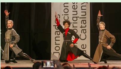
Grup Khorumi de Geòrgia