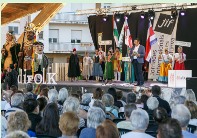
Acte de cloenda al Cobert de la Màquina de Batre amb els grups participants.

El municipi ha acollit la cloenda de la 52a edició de les Jornades Internacionals Folk-lòriques de Catalunya on enguany l'Índia, Geòrgia i Costa Rica han estat els països convidats i l'esbart santfruitosenc Som Riu d'Or hi ha pres part en representació de Catalunya. Els geganters i grallers del municipi també han mostrat la seva imatgeria.