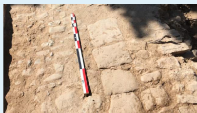
Calçada de l'antic camí

Les obres del nou traçat del collector de salmorres a Sant Benet de Bages han posat al descobert restes arqueològiques que podrien datar de l'època medieval. La principal troballa ha estat un paviment de pedra i un conjunt de llosetes disposades de manera vertical corresponents a la calçada de l'antic camí que dirigia a Sant Benet, una troballa que es troba en perfecte estat de conservació. Un cop finalitzin els treballs es redactarà una memòria científica que permetrà datar-ne exactament el període de construcció.