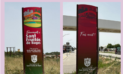
Nous tòtems als accessos del municipi

Des d'aquest estiu els tòtems que donen la benvinguda al municipi s'han renovat amb un nou disseny que reforça la imatge del municipi com a poble modern i atractiu per viure-hi i per fer-hi parada. El disseny mostra els elements turístics i patrimonials més destacats com són el Cobert de la Màquina de Batre, La Sagrera, el monestir de Sant Benet de Bages i els gegants Sala i Ricardis, així com es destaca la importància del passat agrícola amb la imatge dels camps de conreu. També inclou els municipis agermanats amb Sant Fruitós.