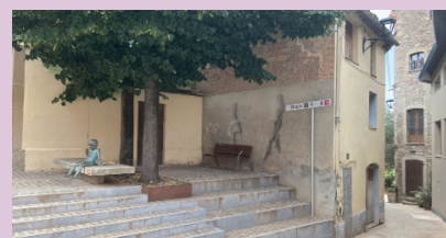
Entrada al carrer Sant Benet

La plaça de l'Era de Cal Vallbona comptarà amb un millor accés, a través del carrer Sant Benet, amb l'enderroc de dues cases que es troben en mal estat de salubritat. Es tracta dels immobles dels números 4 i 6, al lateral esquerre del carrer, que un cop enderrocats permetran una major visibilitat a la plaça, també es conservarà el traçat del carrer Sant Benet amb la construcció d'un petit mur que en delimiti l'espai. L'actuació també inclourà la realització d'un accés directe al pati de l'antic convent de les Monges.