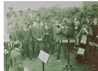
Dècada anys 20 (S.XX)

Enguany farà 46 anys que les Caramelles de Sant Fruitós de Bages es realitzen sota la direcció de l'Agrupació Coral.