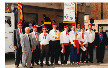
Dècada anys 80 (S.XX)